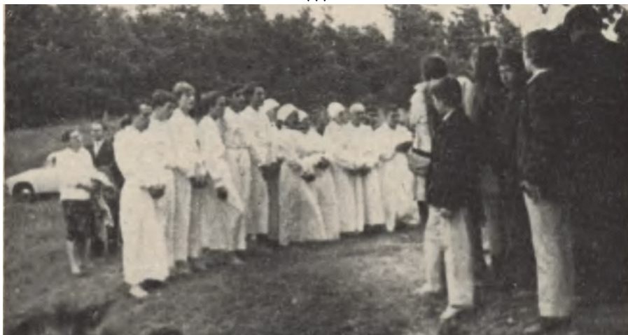
Chrzest w Bydgoszczy

Źródło: „Kalendarz chrześcijanina”, 1974 r. z: Śląska Biblioteka Cyfrowa □