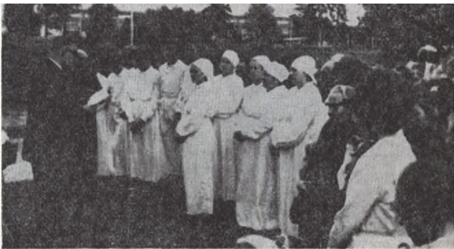
Chrzest w Zborze bydgoskim