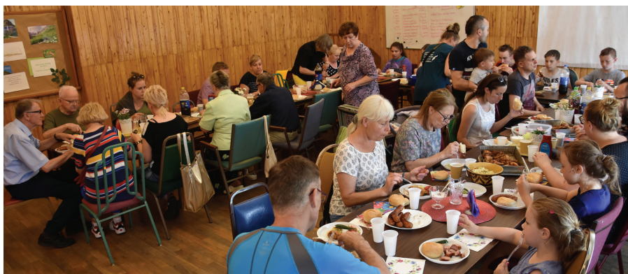
Wyjazd zbiorowy do Łeby, 26-27.09.2020 r.