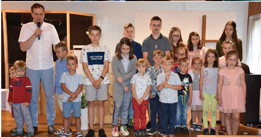
Piknik zborowy, 27.06.2020 r.